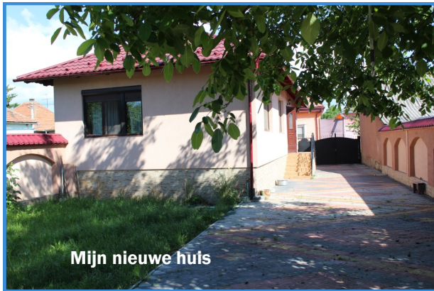
Mijn nieuwe huis

Ook de afgelopen maanden zijn er weer veel dingen gebeurd en daar wil ik jullie over vertellen.